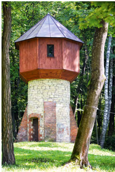
Fot. 14. Wieża widokowa w Krasnobrodzie – niedostępna