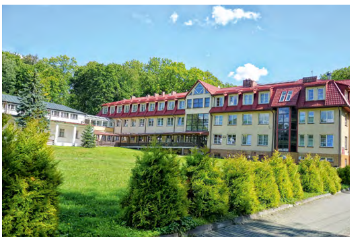
Fot. 8. Sanatorium Rehabilitacyjne im. J. Korczaka w Krasnobrodzie

W licznych drukowanych materiałach promocyjnych i reklamowych o usługach (noclegi, gastronomia, przewodnictwo, wypożyczalnie sprzętu) i imprezach turystycznych (rajdy, spływy) nie znalaziono żadnych ofert dla osób z różnymi rodzajami niepełnosprawności. Wyjątkiem były jedynie reklamy turnusów i pobytów rehabilitacyjnych w ośrodkach uzdrowiskowych, świadczących usługi lecznicze oraz SPA (fot. 8).