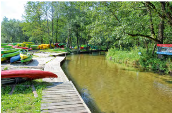
Fot. 11. Przystań kajakowa na Wieprzu – Obrocz