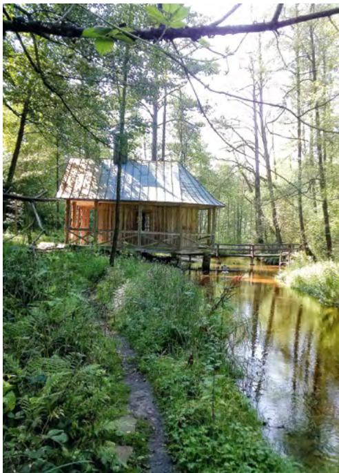
Fot. 17. Kaplica na Wodzie – Górecko Kościelne