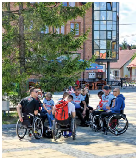
Fot. 19. Rajd niepełnosprawnych turystów – Krasnobród

Integracyjny udział tych osób w cyklicznej, masowej imprezie sportowo-turystycznej pokazał, że aktywizacja osób