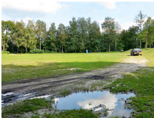
Fot. 6. Parking przed dojściem do Stawów Echo w Zwierzyńcu

Przewodniki wskazują ścieżkę do Stawów Echo w Zwierzyńcu jako jedyną rekomendowaną dla niepełnosprawnych turystów trasę o niewielkim stopniu trudności. Wizytacja potwierdziła dostępność szlaku na dużym odcinku, ale mimo to dojazd do ścieżki, parking i sanitariaty nie były dostępne dla niepełnosprawnych (fot. 6).