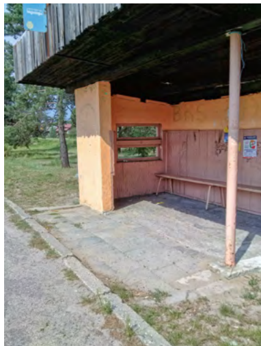
Fot. 3. Przystanek autobusowy w Długim Kącie

znaczone dla tych pojazdów nie są dostosowane do potrzeb i możliwości osób z niepełnosprawnością ruchową (fot. 3). Brakuje też pisemnej informacji o przewozie takich pasażerów. Jednak wywiady z kierowcami busów dowiodły, że wyjątkowo, niektórymi modelami samochodów, jest możliwy przewóz takich pasażerów, ale ich podróż wymaga wcześniejszych ustaleń warunków z dyspozytorem firmy przewozowej i skierowania na trasę specjalnie dostosowanego samochodu.