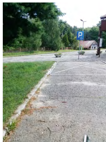
Fot. 5. Specjalne miejsce parkingowe na stacji kolejowej w Suścu