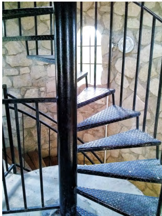
Fot. 15. Wnętrze wieży widokowej w Józefowie

krajobrazu. Taki sposób zwiedzania okolicy Józefowa, Nowin i Krasnobrodu nie jest jednak dostępny dla osób o ograniczonej mobilności ruchowej (fot. 14, fot. 15).