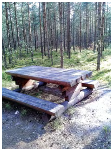
Fot. 7. Miejsce wypoczynku na parkingu śródleśnym – Hamernia

W okolicach nawet najbardziej uczęszczanych szlaków na parkingach nie stwierdzono żadnych udogodnień dla niepełnosprawnych ruchowo turystów.