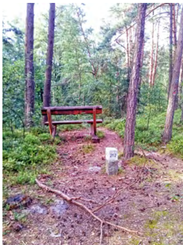
Fot. 10. Punkt widokowy na Szlaku Krawędziowym