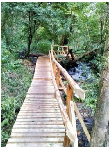
Fot. 9. Ścieżka przyrodnicza w Rezerwacie Czartowe Pole (fot. E. Rutkowska)

Sezonową formą turystycznego podróżowania po Roztoczu są coraz popularniejsze spływy kajakowe na wyznaczonych odcinkach rzek: Wieprz i Tanew. Kilku lokalnych przedsiębiorców proponuje taką atrakcję turystyczną. Obserwacje przystani na szlakach kajakowych oraz oględziny samego sprzętu pływającego wskazują na znaczne trudności w turystyce kajakowej dla osób nie w pełni sprawnych ruchowo (fot. 11, fot. 12).