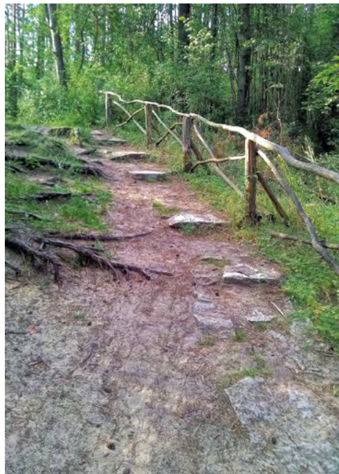
Fot. 18. Dojście do zbiorowej mogiły partyzantów w Puszczy Solskiej

Dotarcie do miejsc upamiętniających wydarzenia historyczne (Powstanie Styczniowe czy walki partyzanckie z okresu drugiej wojny światowej) jest także utrudnione, głównie z uwagi na ich położenie – najczęściej w głębi lasów. Zabiegi porządkowe i konserwatorskie w tych miejscach nie uwzględniają w większości potrzeb osób niepełnosprawnych (fot. 18).