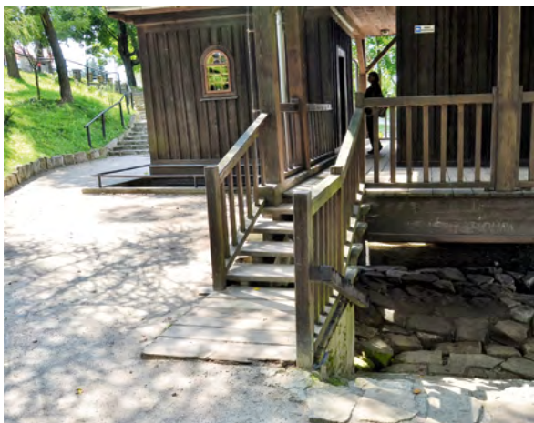
Fot. 16. Kaplica na Wodzie – Krasnobród

Organizatorzy i opiekunowie tych miejsc nie uwzględnili możliwości ruchowych niepełnosprawnych turystów. Na przykład w dotarciu do kaplic na wodzie w Krasnobrodzie i Górecku przeszkadzają pielgrzymom i turystom wąskie ścieżki i schody (fot. 16, fot. 17).