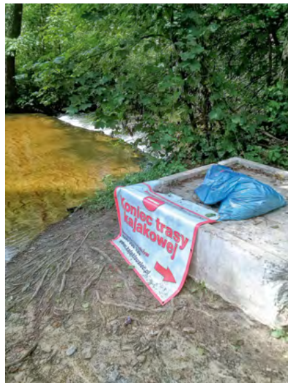
Fot. 12. Przystań kajakowa na Tanwi – Susiec

Przewodnicy napotkani na szlakach kajakowych (Susiec, Obrocz, Zwierzyniec) nie potrafili odpowiedzieć na pytanie o ofertę spływu dla osób niepełnosprawnych. Brakuje udogodnień na przystaniach (często prowizorycznych – tymczasowych) i specjalistycznego sprzętu pływającego.