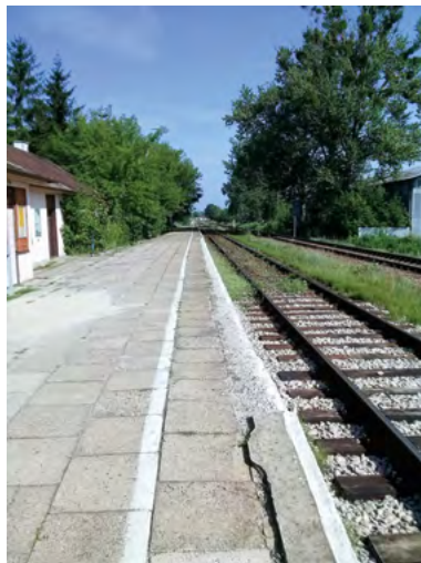
Fot. 1. Stacja kolejowa w Zwierzyńcu

Świeżo wyremontowany przystanek kolejowy w Nowinach jest także trudno dostępny dla osób o ograniczonej sprawności fizycznej: z peronu kolejowego schodzi się bezpośrednio do jezdni drogi