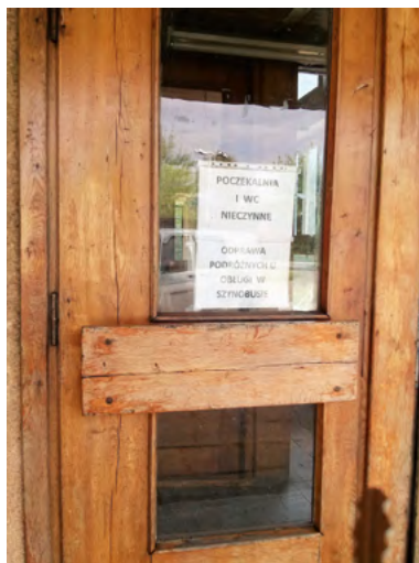
Fot. 2. Infrastruktura stacji kolejowej w Suścu