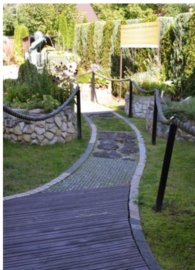
Ilustracja 8. Przykład ogrodu sensorycznego – fragment ścieżki dotykowej na terenie Ogrodu Biblijnego Caritas w Proszowicach

obecnie: w dobie powrotu do holistycznego podejścia do terapii i popularności alternatywnych metod leczenia, obserwuje się wyraźny wzrost zainteresowania ogrodami jako elementami mogącymi odgrywać istotną rolę w terapii 65 . Miejskie przestrzenie rekreacyjne – w tym także obszary rekreacji i nauki (place zabaw, miejskie ogrody sensoryczne i parki doświadczeń), stanowią obszary szczególnie istotne dla dzieci i młodzieży z niepełnosprawnością, wieloaspektowo wspomagając ich rozwój i rehabilitację, w zakresie fizycznym (związanym z działaniami usprawniającymi ogólne funkcjonowanie, mobilność i rehabilitację ruchową), psychicznym (związanym z rehabilitacją psychiczną i kształtowaniem pozytywnych postaw) oraz społecznym i integracyjnym 66 .