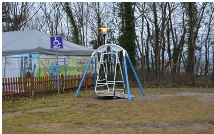
Ilustracja 7. Przykład tworzenia „gett” w obrębie placów zabaw

z przeznaczoną do rekreacji infrastrukturą towarzyszącą, zaprojektowana i wykonana w taki sposób, aby mogli z niej skorzystać wszyscy użytkownicy, w największym możliwym stopniu (godząc potrzeby osób z różnymi ograniczeniami), bez potrzeby adaptacji bądź wyspecjalizowanego projektowania (bez rozwiązań dedykowanych specjalnie dla osób z niepełnosprawnością) 58 .