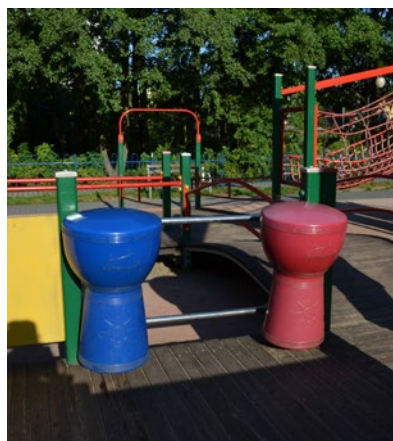
Ilustracja 9. Przykład multisensorycznego placu zabaw: elementy wyposażenia oddziałujące na wszystkie zmysły – plac zabaw na terenie Parku Kilońskiego, Gdynia

Rehabilitacja dziecka z niepełnosprawnością wzroku traktowana jest wspólnie jako wszechstronny, złożony proces, na który składa się szereg różnorodnych oddziaływań medycznych, społecznych i pedagogicznych. Szczególną rolę mogą pełnić w niej przestrzenie zabawy i rekreacji, co podkreślają M. Jakubow-