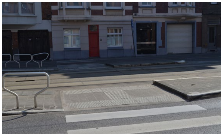
Ilustracja 2. System oznaczeń fakturowych na przejściu dla pieszych, Gent, Belgia

39 W pracy zastosowano określenie systemy prowadzenia lub ścieżki dotykowe , używane w dokumencie Standardy dostępności dla m. st. Warszawy , (dostęp online: http://politykaspoleczna.um.warszawa.pl/niepelnosprawnosci/standardy-dost-pno-ci , data cytowania: 01.2019) oraz analogiczne do nazewnictwa używanego przez PZN (por.: Osoby niewidome i słabowidzące w przestrzeni publicznej , dostęp online: http://www.pzn.org.pl/wp-content/uploads/2015/10/informator.pdf , data cytowania: 01.2019, s. 17–18). Odmienne nazewnictwo stosuje w swoich publikacjach M. Wysocki, używając wymiennie nazw polskich: system fakturowy , oznaczenia fakturowe lub zaczerpniętej z anglojęzycznej literatury przedmiotu nazwy System TGSIs (por.: Projektowanie otoczenia... , s. 89–90 oraz Standardy dostępności dla miasta Gdyni , karta 2-3/4 i 2-4/4). Z kolei autorzy Łódzkiego standardu dostępności systemy prowadzące nazywają po prostu TGSi (por.: Łódzki standard dostępności , s. 24).