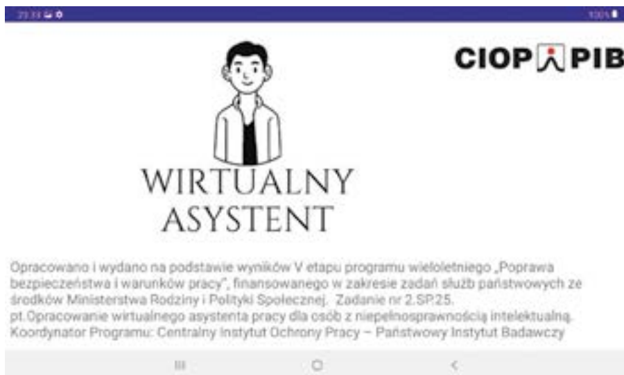
Rysunek 2 Ekran startowy aplikacji Wirtualny asystent

Aplikacja opracowana jest w programie Android Studio, możliwa jest do uruchomienia na systemie operacyjnym Android, zarówno na telefonie komórkowym jak i tablecie (rys. 2), pracuje w trybie offline. Dostęp do Wirtualnego asystenta nie wymaga wpisywania hasła.