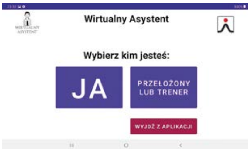
Rysunek 3 Wybór panelu w aplikacji Wirtualny asystent , widok z tabletu

Pierwszy ekran to ekran z menu głównym, czyli przedstawiający główne grupy czynności (rys. 4). Dotknięcie kafelka z tekstem spowoduje odczytanie tekstu przez lektora, dotknięcie kafelka z rysunkiem spowoduje wejście w daną kategorię czynności lub dane zadanie zawodowe.