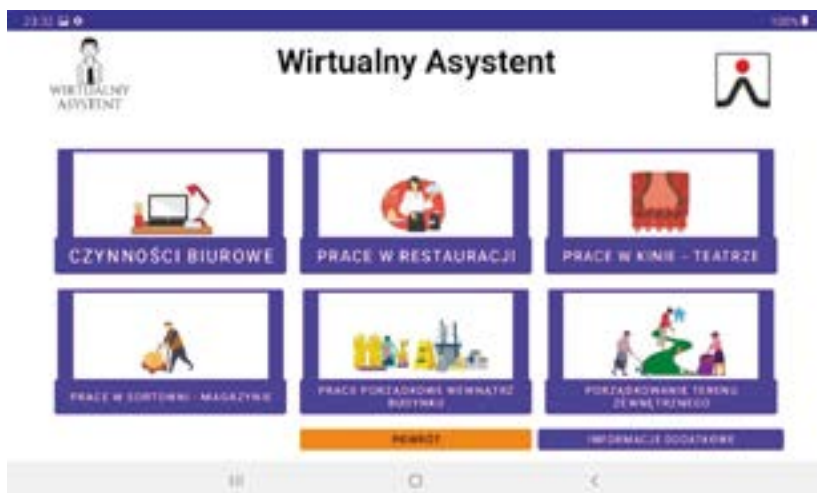
Rysunek 4 Widok menu głównego w aplikacji Wirtualny asystent w profilu „Ja”

Pierwszy ekran to ekran z menu głównym, czyli przedstawiający główne grupy czynności (rys. 4). Dotknięcie kafelka z tekstem spowoduje odczytanie tekstu przez lektora, dotknięcie kafelka z rysunkiem spowoduje wejście w daną kategorię czynności lub dane zadanie zawodowe.