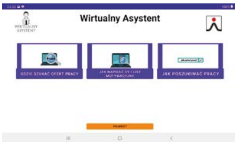
Rysunek 5 Widok menu „Informacje dodatkowe” w aplikacji Wirtualny asystent w profilu „Ja”

Dostęp do profilu „Przełożony/Trener” poza usuwaniem czynności pozwala również na ustawienie czasu pracy i planowanie przerwy dla pracownika. Odliczanie czasu nie jest widoczne dla osoby z niepełnosprawnością, jednak po określonym przez „Przełożonego/Trenera” czasie na jego profilu pojawia się informacja o tym, że należy zrobić przerwę. O zakończeniu przerwy decyduje pracownik z niepełnosprawnością intelektualną poprzez naciśnięcie przycisku „Koniec przerwy” (rys. 6).